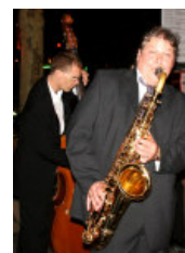
Jazz-Nacht in der Altstadt am 25. August